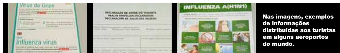
Nas imagens, exemplos de informações distribuídas aos turistas em alguns aeroportos do mundo.

Mais recentemente a Noruega detectou uma mutação do vírus pandémico H1N1 em três casos.