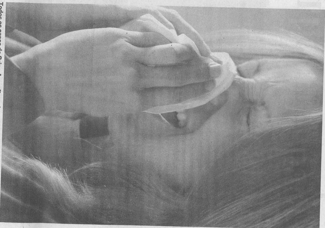
Todos os casos de Gripe A confirmados na Região foram importados.

O mesmo não se poderá dizer acerca do que tem vindo a acontecer no país, onde, entre os quase 400 casos confirmados de Gripe