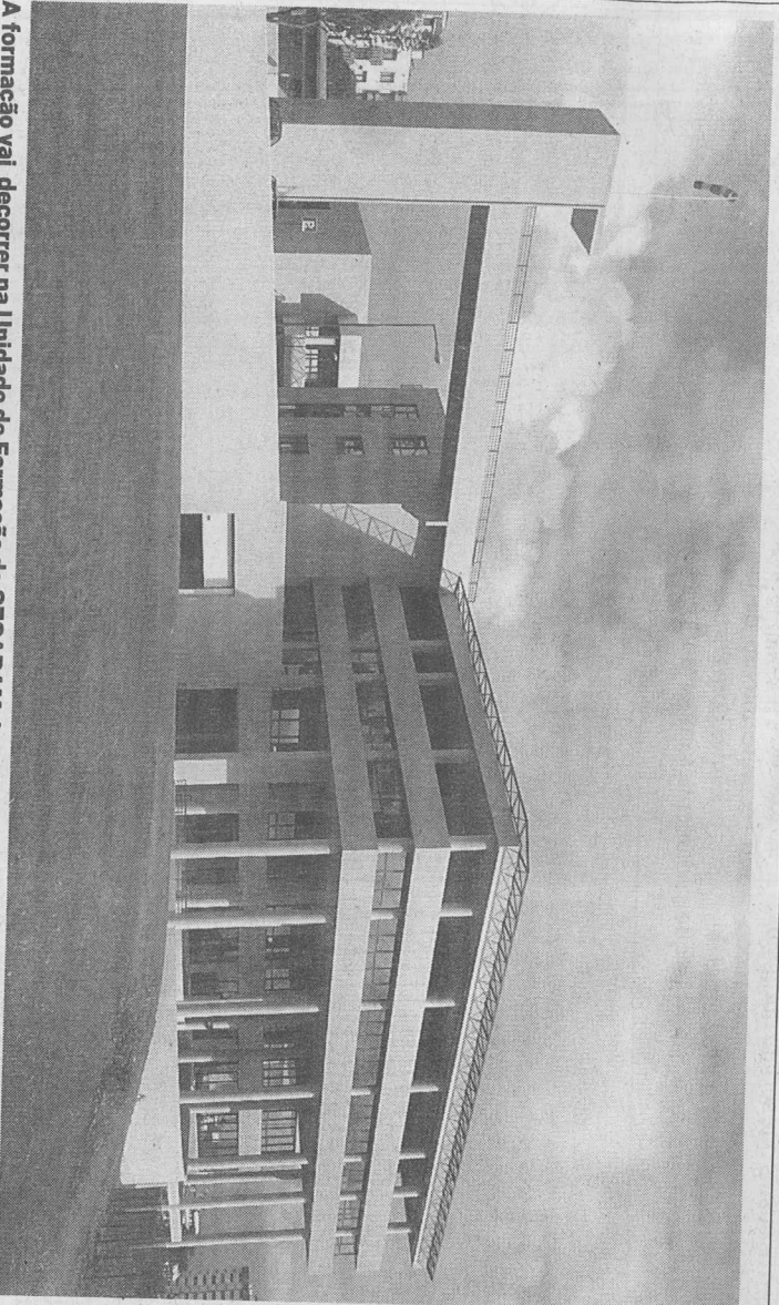
A formação vai decorrer na Unidade de Formação do SESARAM, junto ao Hospital Cruz de Carvalho.

O próximo balanço semanal sobre a infeção pelo H1N1 na Região será divulgado pelo IASAUDE na próxima quarta-feira, dia 12 de Agosto, e vai incluir todos os casos confirmados entre 3 e 9 de Agosto.