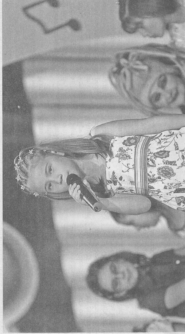
O Festival é sempre uma festa para as crianças que participam e para o público em geral.