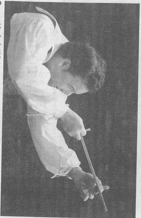
O espectáculo da 'Oficina Versus' estará hoje em cena.

O ginásio, que organiza o evento, aproveita ainda a ocasião para inaugurar o espaço de restauração com comida vegetariana, o Bar Platinum / Bioforma. PH.