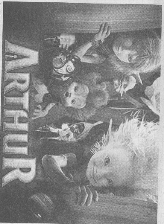
Os Minimeus são seres do tamanho de um dente.

Obras de vários compositores, interpretadas pela Orquestra Bandolins da Madeira, dirigida por Eurico Martins, integram o concerto, agendado para amanhã, às 21 horas na Igreja Inglesa, Rua do Quebra Costas, no Funchal. Os bilhetes estão à venda no Teatro Municipal Baltazar Dias e, no dia do espectáculo, a partir das 20 horas, na Igreja Inglesa.