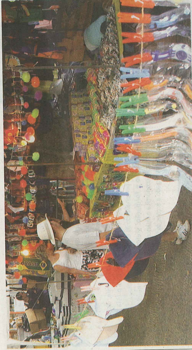
SPA diz que não passa multas, mas sim autorizações para execução pública de obras protegidas.

Na sequência de notícia publicada no Diário de Notícias do dia 15 do corrente sob o título "Chuva de multas em arraial no Caniço", venho por este meio exercer o meu direito de resposta como delegado da Sociedade Portuguesa de Autores na R.A.M.