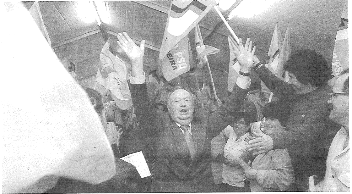
● O presidente do PSD/M volta a reunir a partir de amanhã com as bases do partido. Primeiro no Porto Moniz e, no sábado, em São Vicente.