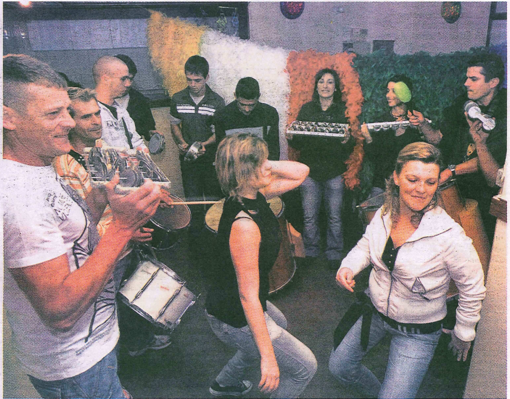
● “Os Cariocas” preparam com todo o afincio o espectáculo do dia 21 de Fevereiro.

● “A Essência do Universo” irá desfiler pelas ruas do Funchal pela mão da trupe “Os Cariocas”, no próximo dia 21 de Fevereiro à noite.