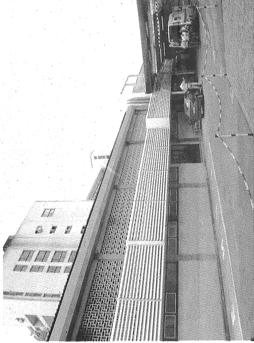
Área da Urgência Pediátrica do Hospital Dr. Nélio Mendonça vai crescer.

Segundo explicou ao DIÁRIO, o Conselho de Administração do SESARAM, com a ampliação da actual área da Urgência Pediátrica (o edifício vai crescer até à área onde existe actualmente um 'barracão'), serão atendidas com mais espaço as crianças até aos 17 anos de idade. Com a ampliação vai também 'crescer' o espaço destinado à Diálise (com o objectivo de instalar mais máquinas). O SESARAM pretende também instalar a antiga máquina de TAC - Tomografia Axial Computadorizada - que está desligada (a máquina mais recente está a funcionar normalmente no serviço de Radiologia) na nova área do Serviço de Urgência, por forma a dar resposta mais